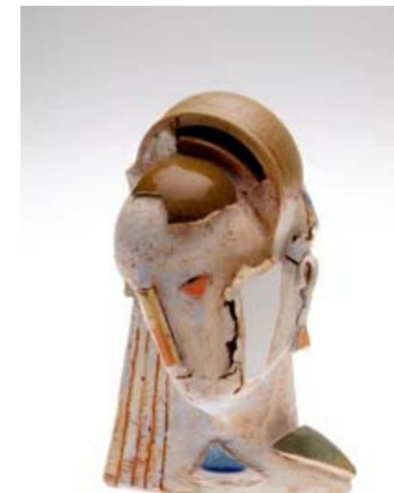
„Kopf I“ Keramik, 30 x 20 x 20 cm, 2006 Angelika Waskönig

Silvia Steinz . Bannzeile 25 . 86911 Diessen am Ammersee Tel.: 0 88 07 / 87 29