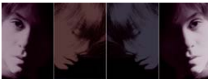
„hört ihr euch“ 4 Cromadruce, 50 x 132 cm 1 Schriftbild 21 mal 29,5 cm Thomas Schmid

Bankverbindung Sparkasse Landsberg Konto: 81166 BLZ: 70052060