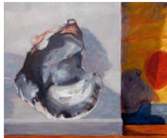
„Fundstück / Langeoog“ Öl auf Leinwand, 155 x 130 cm Burkhard Niesel

Hans Neuhauser Registerstr.1 . 86911 Riederau Zeichnerei@Gmx.net