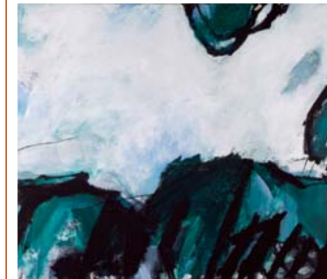
„Heimat“ Acryl auf Leinwand, 110 x 130 cm Anemone Rapp

Bert Praxenthaler . Bahnhofstr. 12 . 86929 Penzing/Epfenhausen Tel.: 0 81 91 / 98 91 57 . eMail: bert@praxenthaler.de