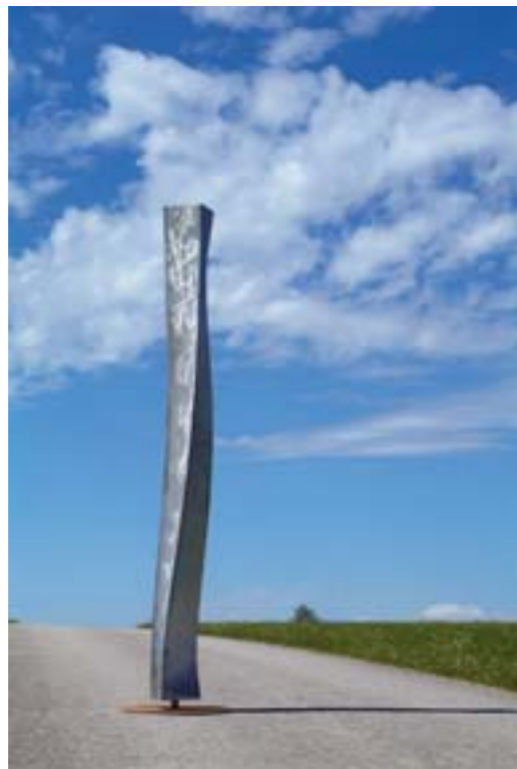
„Ballerina“ Edelstahl / Stahl, Höhe 256 cm Thomas Lenhart

Hubert Lang . Ludwig Lang Str. 15 . 82487 Oberammergau Tel.: 0 88 22 / 4174