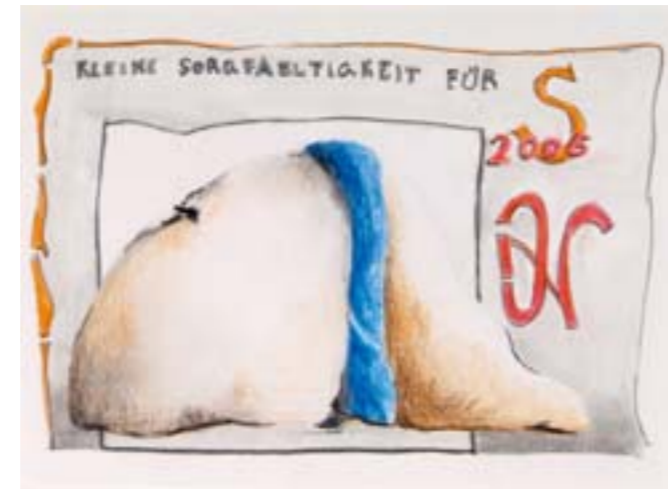
„S“ Farbstift auf Papier, 17 x 20 cm, 2006 Hans Neuhauser

Thomas Lenhart atelier für metallgestaltung und licht Moosstr. 4 . 82279 Eching am Ammersee Mail: atelier.lenhart@online.de . www.glasschmiede.de